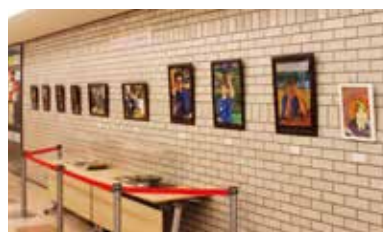
▲当社内幸町本社地下2階の商店街壁面に作品を展示。