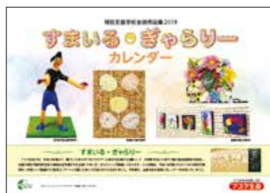
▲当社作成のカレンダー