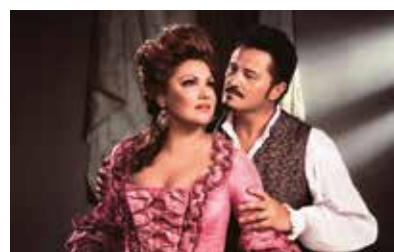
METライブビューイング2018-19 《アドリアーナ・ルクヴルール》

ニューヨーク・メトロポリタン歌劇場 (MET) で上演されたオペラ公演をハイビジョン映像で映画化し、上映する「METライブビューイング (松竹株式会社配給)」に協賛しております。最上級のオペラ芸術に接する機会をご提供する活動に協賛することで、芸術文化振興に貢献しております。